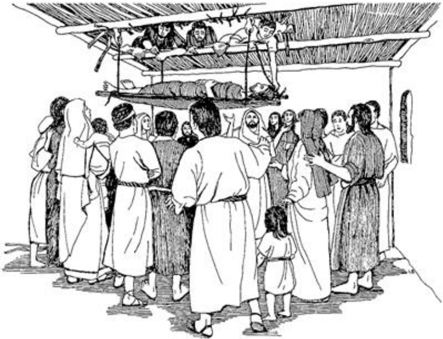
Wo cɔ dɔnɔ toxɔta dɔ Yesu ŋkɔ (5.19)

amɛ a wo dɔŋdomɛ, lɛ Yesu ŋkɔ. 20 Kɛ Yesu kpɔ sigbɛ wo xɔ ɛ sɛ a, ɛnu nɛ dɔnɔ a bɛ: «Ɛxɔnɔyɛ! Wo cɔ tɔɔ nuvɛnwo sɛ kɛ o.» 21 Ɛsɛkpramɛtɔwo kidɛ Farizitɔ kɛ leena dɛ a wo tɔ bubukpɔ lɛ wo dɛkiwo mɛ bɛ: «Ŋucu kee nyi ila, i lɛ xonu dɛ ɔ̀gɔ nɛ Mawu a ma? Amɛdɛken ŋ ka tɛ ŋ cɔ ɔ̀gɔjɛjɛ sɛkɛ amɛ, zɛn lɛ Mawu dɛken ŋ o!» 22 Yesu mɔŋjɛ susu kɛ wo lɛ dɛ a mɛ, i lɛ kawose bɛ: «Nukeejɔ i mi lɛ dɛ susu hunna mɔnkiwo? 23 Nɛ wo a nu bɛ: "Wo cɔ tɔɔjɛjɛwo sɛ kɛ o", nɔmi "cɔ jɛtɛ i zɔn a dɛe"; kee i bubɔ wu ɛdɛ lɛ nuxo amɛnɛ ŋnawo mɛ? 24 Vɔ̀ a, ŋ ji bɛ mi a nya bɛ, Ɔgbɛtɔvia wɔ ɔ̀cɛ kɛ la cɔ ɔ̀gɔjɛjɛ sɛ kɛ amɛ a dɛ lɛ anyigbanji.» Kɛ i nu ɛnɛ jɔɔ a, ɛ va dɛgbɛ nɛ ŋucu kpɔɔbɔnɔ a bɛ: «Co jɛtɛ nɛ na cɔ tɔba i yi tɔɔxomɛ!» 25 Zedɛka a, ŋucu a cɔ jɛtɛ kprɔŋ lɛ amɛsyamɛ ŋkɔ, i cɔ ɛba kɛji i mre do dɛ a, i jɛŋkɔ yexomɛ, i tɔ Mawu kafukafu. 26 Ɛ jiwun nɛ amɛ kɛ l'ɛnawo see i wo tɔ Mawu kafukafu. Vɔnɔn jɛwoji i wo tɔ nunuji bɛ: «Mi kpɔ amrimanu dɛkawo gba!»