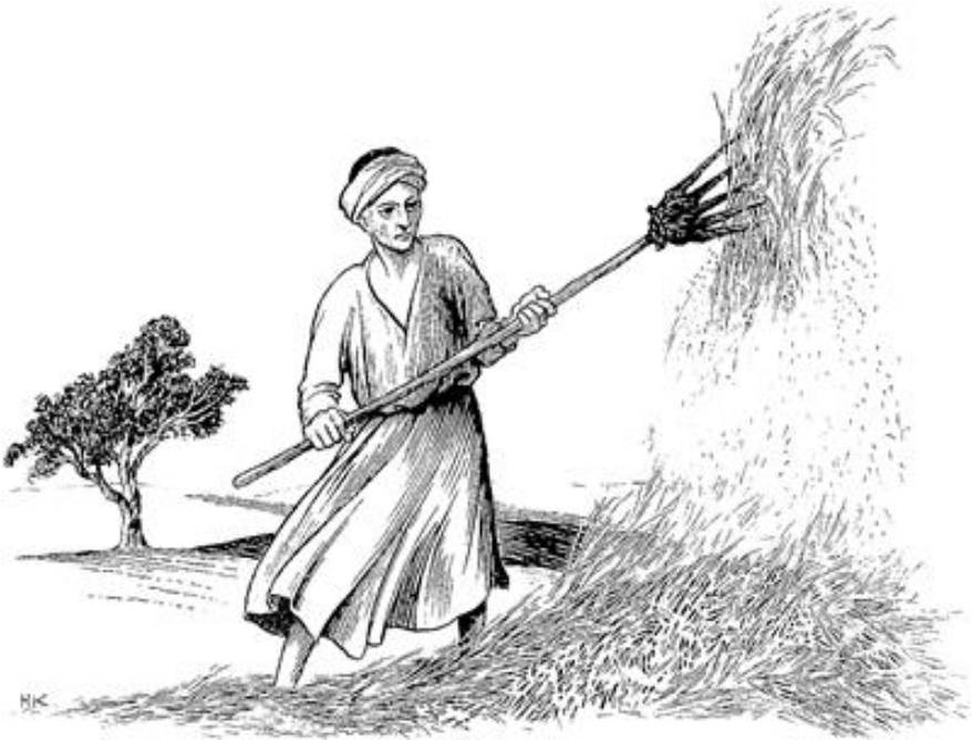
Enu fu nu (3.17)

ɲci nɔ gbɛɔ a mɛ. 18 To ɛnukpramɛ sɔgbɔ bulɔmɛ wo mɛ, i Jaan do ɛɲɛ nyɛ a nɛ ɛduviwo. 19 Jaan va gbɛ ɛnyɔ ɔkɛawo nɛ Erodu kɛ nyi ɛgan ɔɛ lɛ Galilee kanmɛ a. Ɖo Erodu xɔ nɔvia* ɛsi kɛ wo yɔ nɛ bɛ Erodiadɛ a i sɛ ɔɛ; i gbɛ trɔ wo ɛnuvɔɛn bulɔmɛ wo. 20 Erodu gbɛ trɔ dosin ɛnuvɔɛn bulɔmɛ dɛ kɛ i wɔ vayi a wo ji: Ye i nyi Jaan kɛ i lɛ dɛ gɔkpramɛ a.